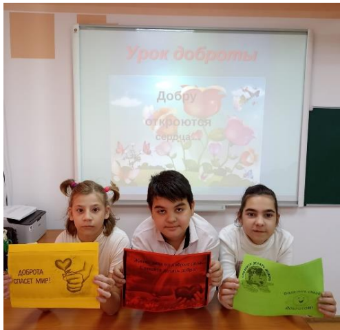
Работа с пословицами о доброте