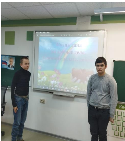
Работа со слайдами

В ходе занятий учащиеся вместе с учителем размышляли о важнейшей нравственной ценности: добре и уважении, разбирали ситуации из жизни, а также рисовали символы добра.