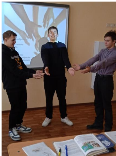
Тренинг: «Дай свою руку»