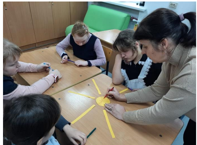
Игра: «Оживи солнышко»