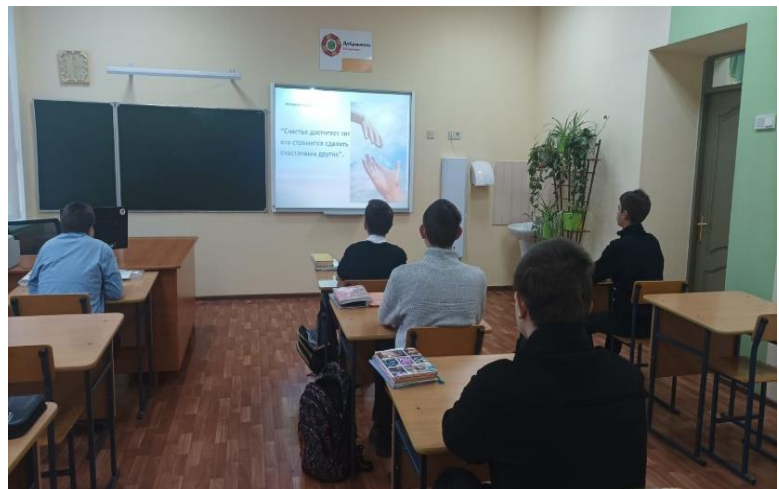
Разбор пословицы о доброте

Классные руководители 8,9 классов, группы профессионального обучения организовали «Час общения». Подростки учились формировать в себе важные этические нормы поведения в обществе и общения друг с другом, развивать свою эмоционально-ценностную сферу.