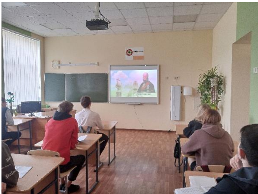
Демонстрация видеоролика «Крым в сердце каждого из нас».