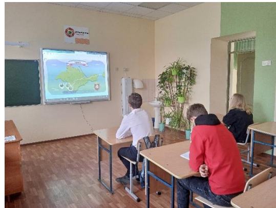
Интерактивное задание «Крым в составе России».

Поставленные цели и задачи занятия были реализованы.