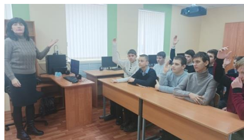
Обсуждение направлений деятельности РДДМ

Поставленные цели и задачи занятия были реализованы.