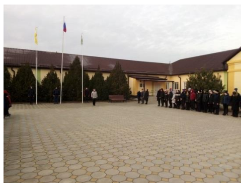
Церемония поднятия флага

В 8.20. - каждое утро понедельника в ОУ начинается с поднятия флага под гимн РФ. Затем проводится общешкольная беседа, согласно установленному циклу мероприятий. Затем все обучающиеся проходят по своим классам и продолжают работу по теме.