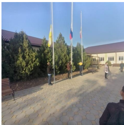
Церемония поднятия флага

В 8.20. - каждое утро понедельника в ОУ начинается с поднятия флага под гимн РФ. Затем проводится общешкольная беседа, согласно установленному циклу мероприятий. Затем все обучающиеся проходят по своим классам и продолжают работу по теме.