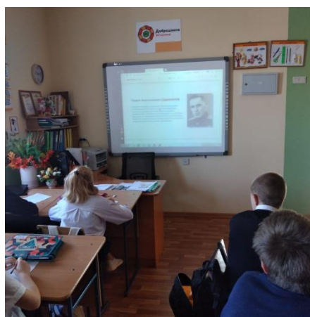
Демонстрация видеоролика федеральных спикеров, презентации «Цитаты»

Поставленные цели и задачи занятия были реализованы.