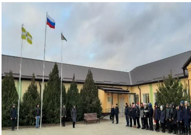
Церемония поднятия флага

В 8.20. - каждое утро понедельника в ОУ начинается с поднятия флага под гимн РФ. Затем проводится общешкольная беседа, согласно установленному циклу мероприятий. Затем все обучающиеся проходят по своим классам и продолжают работу по теме.