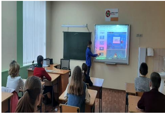
Демонстрация интерактивного задания: «Защита профиля»