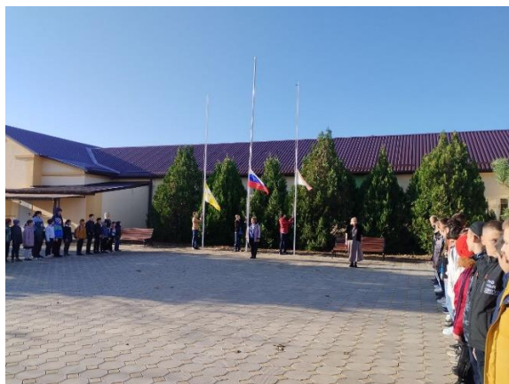
Церемония поднятия флага

В 8.20. - каждое утро понедельника в ОУ начинается с поднятия флага под гимн РФ. Затем проводится общешкольная беседа, согласно установленному циклу мероприятий. Затем все обучающиеся проходят по своим классам и продолжают работу по теме, согласно плана.