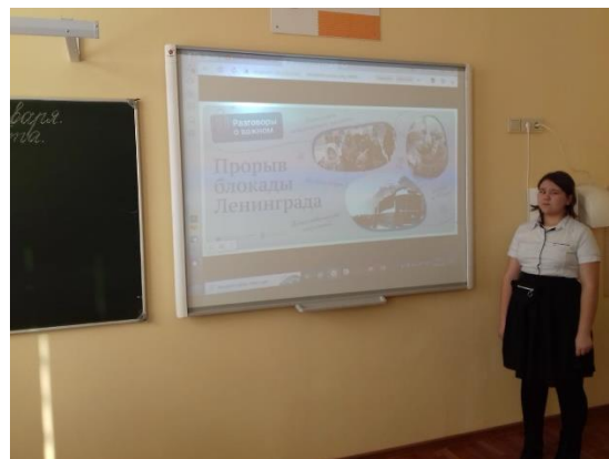
Работа со слайдами по теме

Поставленные цели и задачи занятия были реализованы. По итогам каждого занятия формулируются вопросы и задания для обсуждения дома с родителями.