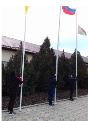
Церемония поднятия флага

В 8.20. - каждое утро понедельника в ОУ начинается с поднятия флага под гимн РФ. Затем проводится общешкольная беседа, согласно установленному циклу мероприятий. Затем все обучающиеся проходят по своим классам и продолжают работу по теме.