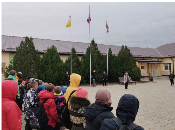
Церемония поднятия флага

В 8.20. - каждое утро понедельника в ОУ начинается с поднятия флага под гимн РФ. Затем проводится общешкольная беседа, согласно установленному циклу мероприятий. Затем все обучающиеся проходят по своим классам и продолжают работу по теме, согласно плана.