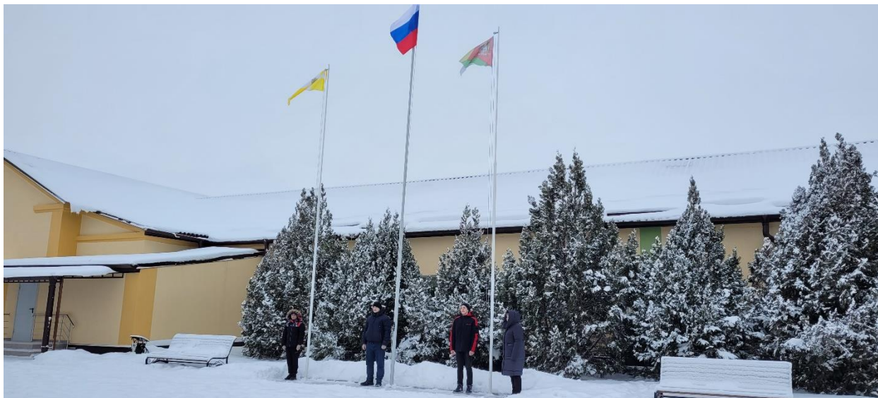
Церемония поднятия флага

В 8.20. - каждое утро понедельника в ОУ начинается с поднятия флага под гимн РФ. Затем проводится общешкольная беседа, согласно установленному циклу мероприятий. Далее все обучающиеся проходят по своим классам и продолжают работу по теме.