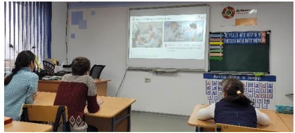
Просмотр видеоролика об ученых и их изобретениях