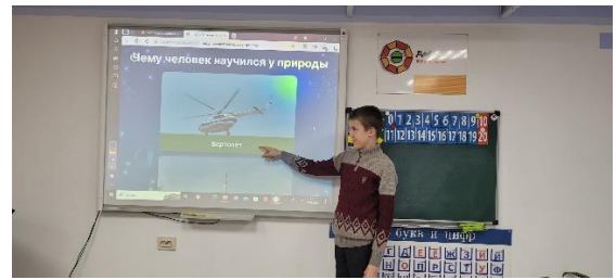
Выполнение интерактивного задания «Чему человек научился?»

Поставленные цели и задачи занятия были реализованы.