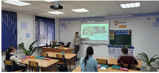
Знакомство с историей праздника