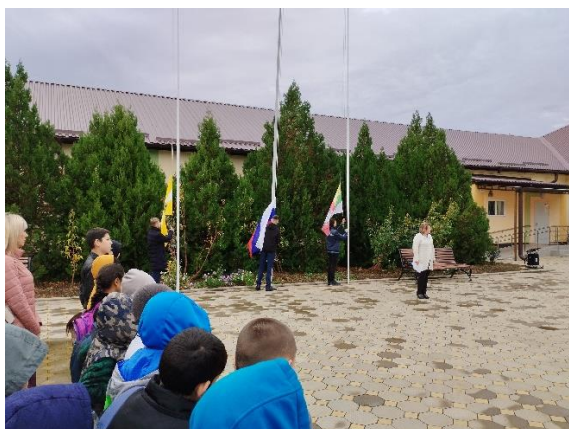
Церемония поднятия флага

В 8.20. - каждое утро понедельника в ОУ начинается с поднятия флага под гимн РФ. Затем проводится общешкольная беседа, согласно установленному циклу мероприятий. Затем все обучающиеся проходят по своим классам и продолжают работу по теме, согласно плана.