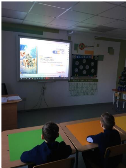
Знакомство с историей праздника Рождество