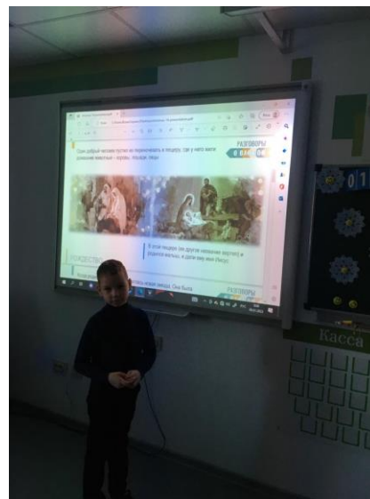
Подготовка к выполнению творческой работы

Поставленные цели и задачи занятия были реализованы.