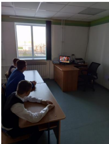
Беседа по слайдам презентации