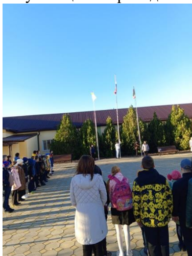
Церемония поднятия флага

В 8.20. - каждое утро понедельника в ОУ начинается с поднятия флага под гимн РФ. Затем проводится общешкольная беседа, согласно установленному циклу мероприятий. Затем все обучающиеся проходят по своим классам и продолжают работу по теме.