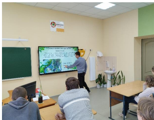
Интерактивное задание «Экологические профессии».

Поставленные цели и задачи занятия были реализованы. По итогам каждого занятия формулируются вопросы и задания для обсуждения дома с родителями.