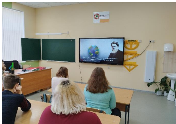
Демонстрация видеоролика «Владимир Иванович Вернадский – великий российский ученый и мыслитель».