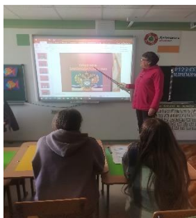
Кодекс законов о труде

В ходе урока педагог-навигатор использовал интерактивные элементы: вопросы по теме урока, взаимодействие с обучающимися с опорой на имеющиеся знания и наблюдения.