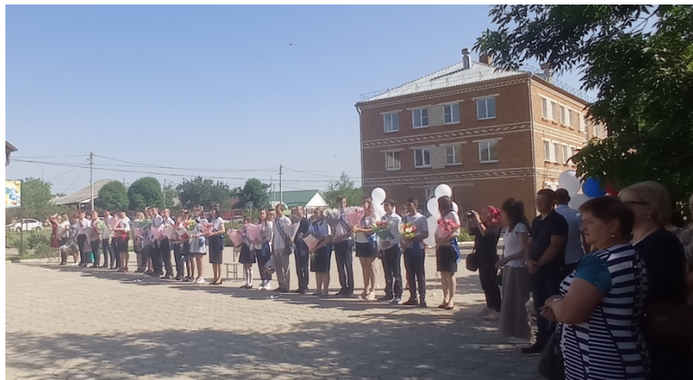
Выпускники 9 класса, ГПО

Фото и видео съемка праздника велась с использованием фотоаппарата D3500 AF-P DX NIKKOR 18-55 mm VR Kit, так же приобретенном в рамках федерального проекта «Современная школа» национального проекта «Образование» в 2019г., по направлению дополнительного образования. На память о школьных днях останутся фотографии с интересными отрывками школьной жизни. Последний звонок – это, всё-таки праздник, знаменующий начало нового жизненного этапа, переход в неизведанный, но такой манящий мир.