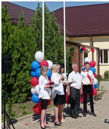
Вручение документов об образовании

Фото и видео съемка праздника велась с использованием фотоаппарата D3500 AF-P DX NIKKOR 18-55 mm VR Kit, так же приобретенном в рамках федерального проекта «Современная школа» национального проекта «Образование» в 2019г., по направлению дополнительного образования. На память о школьных днях останутся фотографии с интересными отрывками школьной жизни. Последний звонок – это, всё-таки праздник, знаменующий начало нового жизненного этапа, переход в неизведанный, но такой манящий мир.