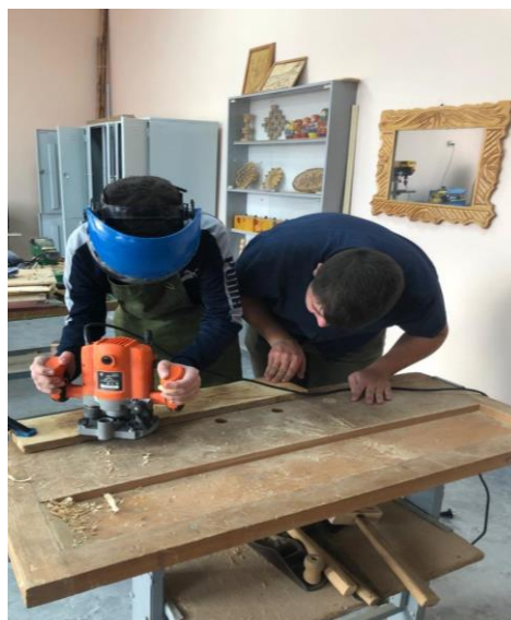
Практическая работа на уроке

Полученные знания подтвердили в ходе выполнения практической работы.