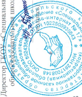
ГРАФИК ПРЕДОСТАВЛЕНИЯ ПРОДУКТОВЫХ НАБОРОВ

обучающимся ГКОУ «Специальная (коррекционная) школа-интернат № 17» (с выездом на места проживания обучающихся к льготным категориям граждан, на период реализации АООП с применением дистанционных образовательных технологий в условиях ситуации, связанной с распространением коронавирусной инфекции (в соответствии с пунктом 14 постановления Губернатора Ставропольского края от 26 марта 2020г. №119 «О комплексе ограничительных и иных мероприятий по снижению рисков распространения новой коронавирусной инфекции COVID-19 на территории Ставропольского края, с изменениями, внесенными постановлениями Правительства Ставропольского края» от 10 апреля 2020г. №139 и от 13 апреля 2020г. №142), приказа министерства образования Ставропольского края от 13 апреля 2020г. №464-пр «О предоставлении продуктовых наборов отдельным категориям, обучающимся»