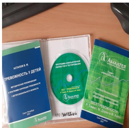
Программа компьютерной обработки и тестирования с авторским руководством Астапова В.М. «Тест тревожности Р. Тэммл, М. Дорки и Ф. Амен»

Проведенное тестирование дало возможность выявить особенности детей младшего школьного возраста, оно было проведено в доступной для детей форме рисуночного теста, с возможностью количественной и качественной обработки.